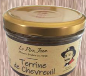
Terrine de Chevreuil