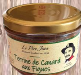
Terrine de Canard aux Figs