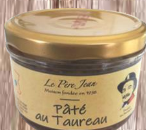
Terrine de Taureau