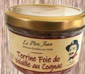
Terrine foie de volaille au Cognac