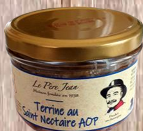
Terrine au St Nectaire