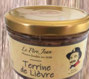
Terrine de Lièvre