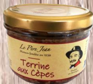
Terrine aux Cèpes