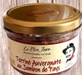
Terrine Auvergnate Au jambon de Pays