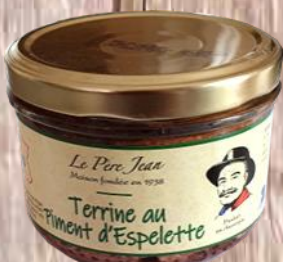
Terrine au Piment d'Espelette