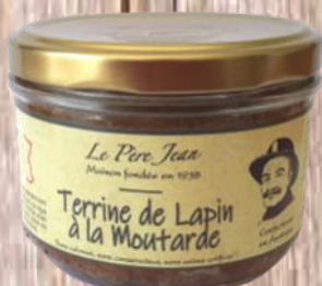
Terrine de Lapin À la Moutarde