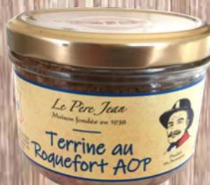
Terrine Paysanne au Roquefort