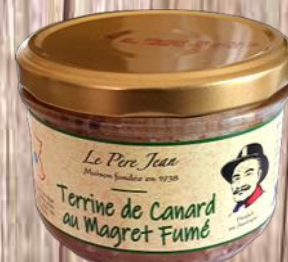
Terrine de Canard au magret fumé