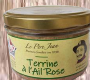
Terrine à l'Ail Rose