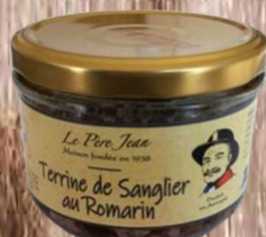
Terrine de Sanglier au Romarin